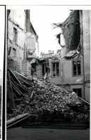
Fot. 6. Ruiny jednego z podwórek Śródmieścia, Warszawa